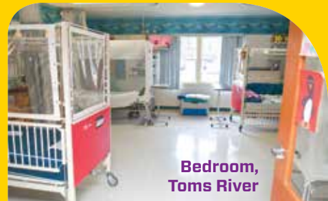
Bedroom, Toms River