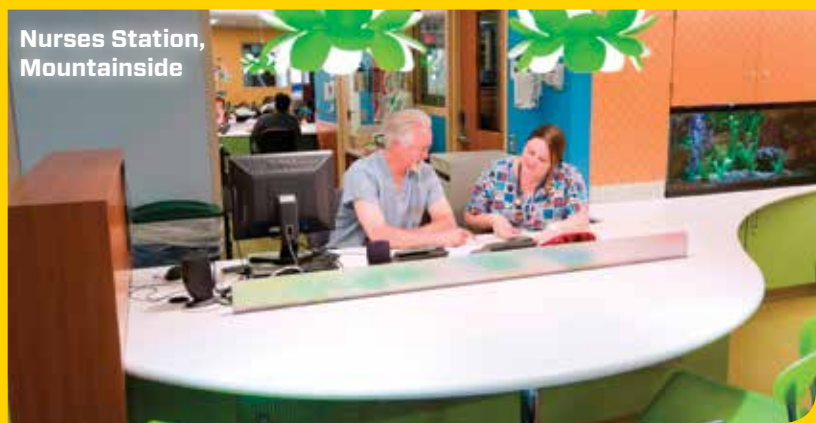
Nurses Station, Mountainside