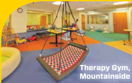
Therapy Gym, Mountainside