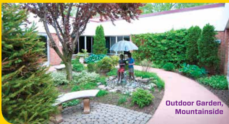
Outdoor Garden, Mountainside

Our commitment to Patient and Family Centered Care sets us apart from other Pediatric Long Term Care Centers by ensuring that your goals for your child are heard and incorporated into their medical and therapeutic care plan. Our team of medical, respiratory, and therapeutic health care professionals develop each child’s unique care plan by partnering with your family to best meet the medical and emotional needs of your child.